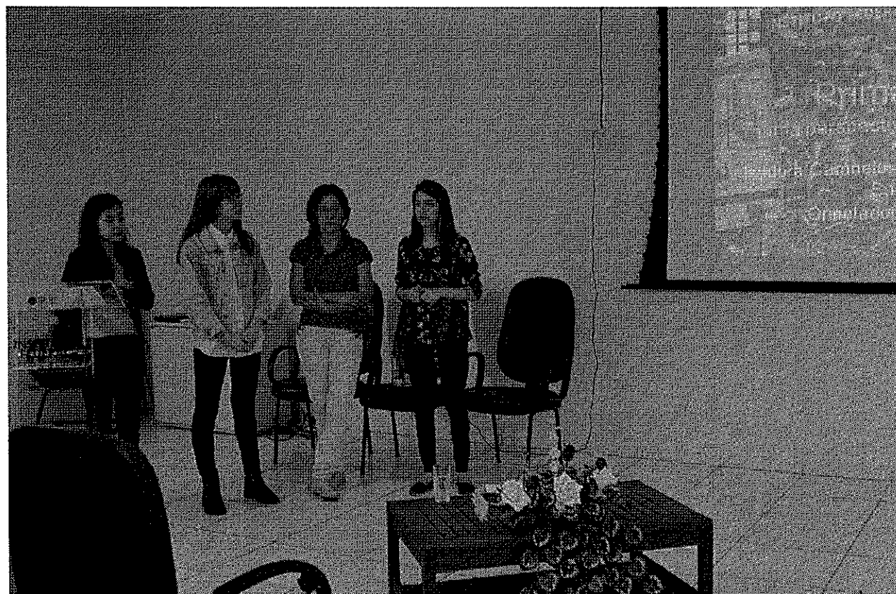
Foto 2- Apresentação das estudantes palestrantes do evento.