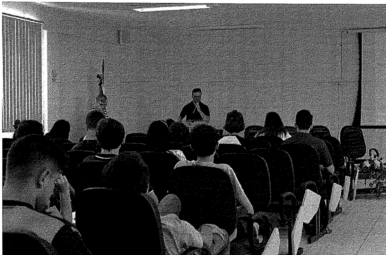
Foto 1- Abertura do evento