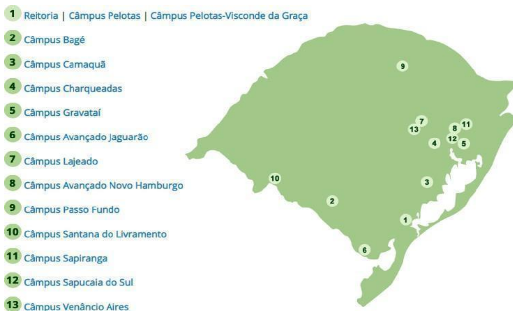
Figura 1 - Distribuição das unidades do IFSul pelo estado

Segundo a Plataforma Nilo Peçanha (PNP), que reúne dados da Rede Federal de Educação Profissional, Científica e Tecnológica (Rede Federal) para fins de cálculos de indicadores, o IFSul atende um total de 24.369 discentes (ano base 2018), matriculados em cursos nas modalidades presencial e a distância. Também exerce o papel de instituição acreditadora e certificadora de competências profissionais.